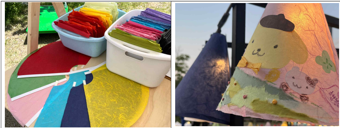
< 한지등: 지름 19cm, 높이 22cm >

○ 한지등 디자인 및 구성 : 플라스틱 갓(프레임) 색상 랜덤 발송, 꾸밈 한지(8색)